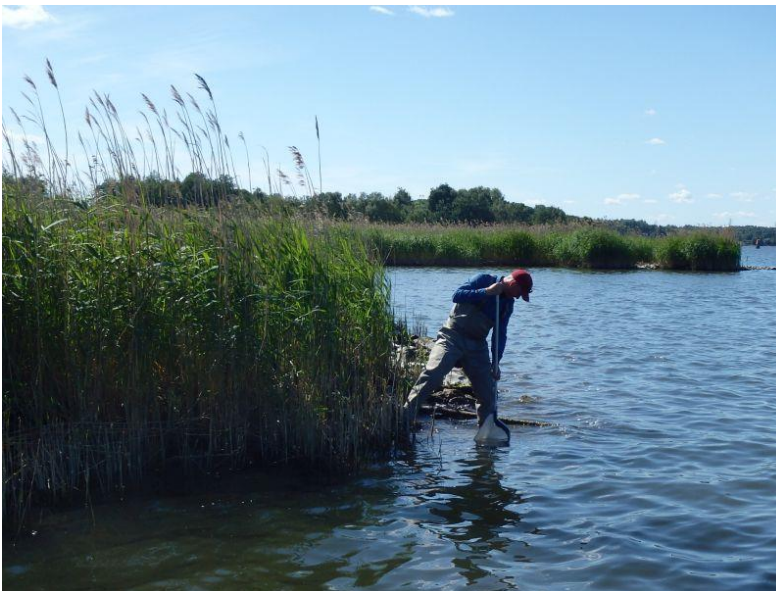
Figur 2. Undersökning av bottenfauna genom sparkmetoden.

Naturvärdesinventering avseende biologisk mångfald (NVI) är en relativt ny metod/standard som är fastställd och publicerad i maj 2014 (SIS 2014a, 2014,b). Det huvudsakliga syftet med en NVI är att beskriva och värdera naturområden för att identifiera biologisk mångfald i ett avgränsat område. Naturvärdesinventeringar tas ofta fram som underlag till miljökonsekvensbeskrivningar (MKB) för att kunna bedöma påverkan på naturmiljöer vid exploateringar, som till exempel vägar, järnvägar, detaljplaner, vindkraft och miljöfarlig verksamhet.