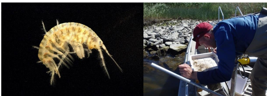
Figur 4. Den invasiva märkräftan Gammarus tigrinus samt okulär undersökning av bottenfauna.

Inga ovanliga eller skyddade bottenfaunaarter påträffades under inventeringen.