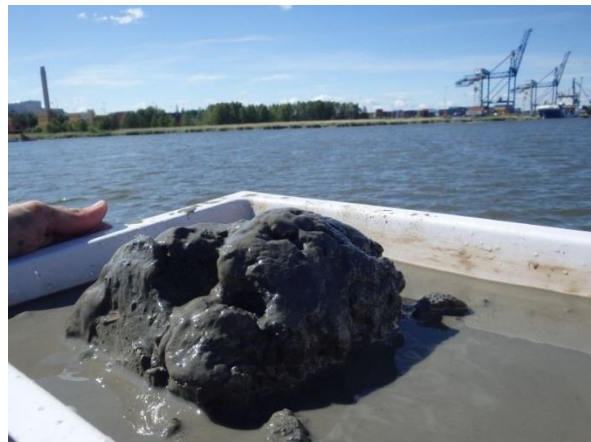
Figur 3. Sedimenten inom inventeringsområdet dominerades av gyttja och lera. I bakgrunden kan man se pampuskajen.

Vattnet var klart men mycket grumligt. Bottnen var relativt jämn med en muddrad djupare del centralt. Sedimenten bestod främst av gyttja med inslag av lera, sten och silt (Figur 3). Närmast stranden vid Händelö övergick bottnen i sten och block.