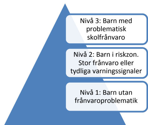
Figur 3. Rutiner för arbetet med elevfrånvaro inom grundskola/grundsärskola i Uddevalla kommun, (Uddevalla kommun, 2014).

Handlingsplanen är utformad utifrån trenivåer gällande frågan om skolfrånvaro, som illustreras i modellen nedan: