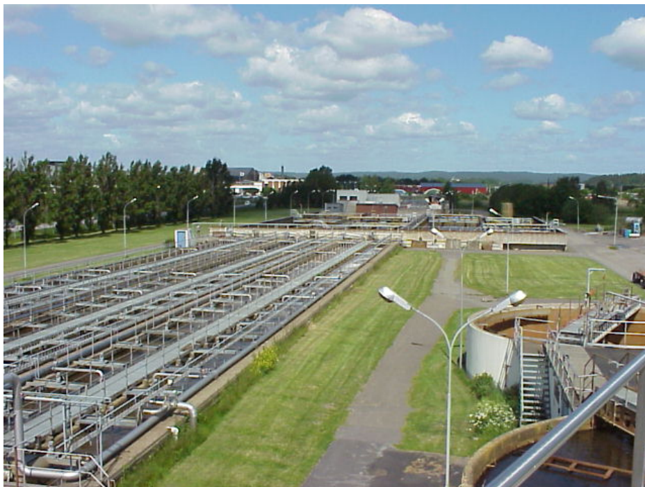
Vy över delar av Slottshagens avloppsreningsverk, Norrköping.

Även Miljöbalkens allmänna hänsynsregler är tillämpliga på den enskilde. Framst är det kanske reglerna om att ersätta kemiska produkter som kan innebära risker för människor eller för miljön som kan tillämpas på VA-försörjningen och då allra främst i situationer där avloppsreningen är bristfällig.