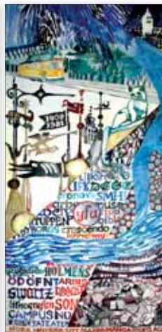
Gobeläng 6: På sta'n under 1900-talet

Under andra delen av 1800-talet utvecklades den redan starka ylleindustrin och man kan nu börja tala om stordrift.