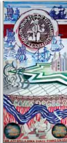
Gobeläng 3: 1600-talet

Den första bebyggelsen växer upp. Norrköping fick troligen sina stadsrättigheter under 1300-talets första del. Nedtill syns det bekräftelsebrev från 1384, där kung Albrekt av Mecklenburg fastställde stadens gränser.