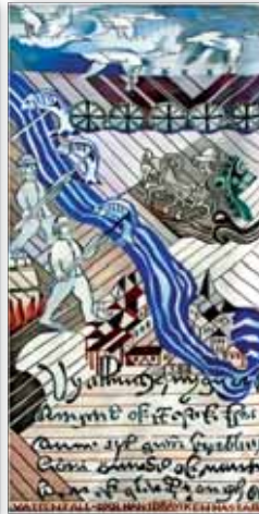
Gobeläng 2: Medeltiden

Den första gobelängen visar ett vinterlandskap under bronsåldern för cirka 3000 år sedan. Den fåtaliga befolkningen försörjde sig som jägare, fiskare och ett mycket primitivt jordbruk.