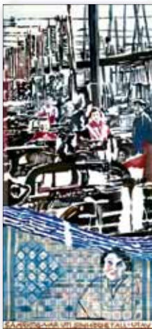
Gobeläng 5: Textilfabrik i slutet av 1800-talet

I den fjärde gobelängen ger konstnären en bakgrund till storindustrins intåg i Norrköping. Industrilandskapet har gett staden en helt ny profil. De de mäktiga skorstenarna ger en helt ny karaktär åt staden.