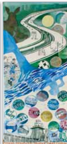
Gobeläng 7: Ballonger över sta'n

En sommarpromenad någon gång under 1900-talet. Fest i sta'n. Högst upp ses ett fyrverkeri och siluetten av Rådhusets torn och två tydliga kännetecken för staden - spårvagnarna och promenaderna finns också med.