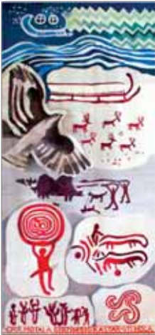
Gobeläng 1: Bronsåldern

Torsalen i Norrköpings Rådhus (100 år 2010) har fått en sentida, konstnärlig utsmyckning. Det är åtta gobelänger som visar Norrköpings historia. De invigdes 2006. Noteras kan att kommunrevisionens historia i Norrköping sträcker sig så långt tillbaka som till 1300-talet.