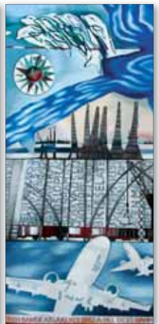
Gobeläng 8: Norrköping som transport- och logistikcentrum

Ballonger, med namn på personer som vid olika tidpunkter haft betydelse för Norrköping släpps upp. Kolmården och E4:an syns i vävens övre del. Längst ner konst- och industriställningen 1906.