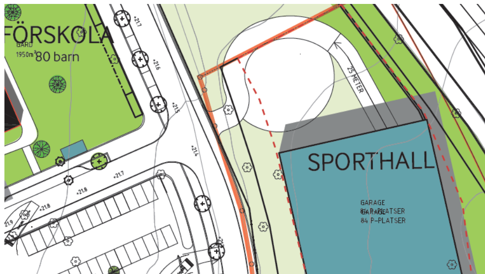
Illustrationen ovan visar vändyta inom sporthallens tomt. Illustration: Arkitektgruppen GKAK.