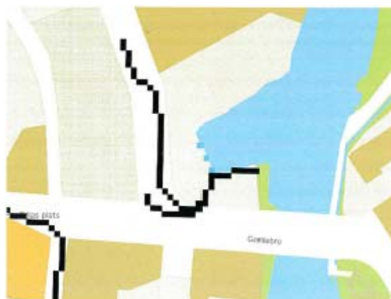
Figur 1: Rinnväg (svart linje) för extrem regn inom planområdet enligt Länsstyrelsens skyfallsanalys.

I dagsläget finns en rinnväg inom detaljplaneområdet enligt länsstyrelsens skyfallsanalys. Det är viktigt att säkra rinnvägarna för extrema regn så att de kan ledas på gatan ner och ut på Gamlebro och inte riskera att ledas in i området, alternativt att en säker rinnväg skapas inom området.