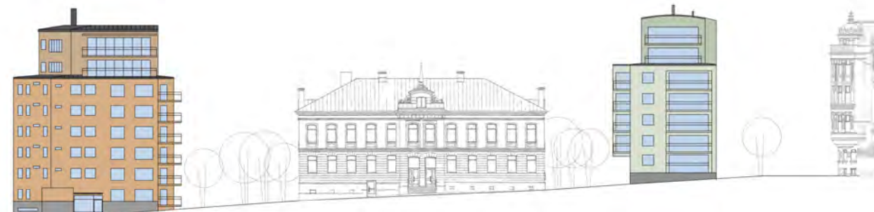
Fasad mot Plankgatan