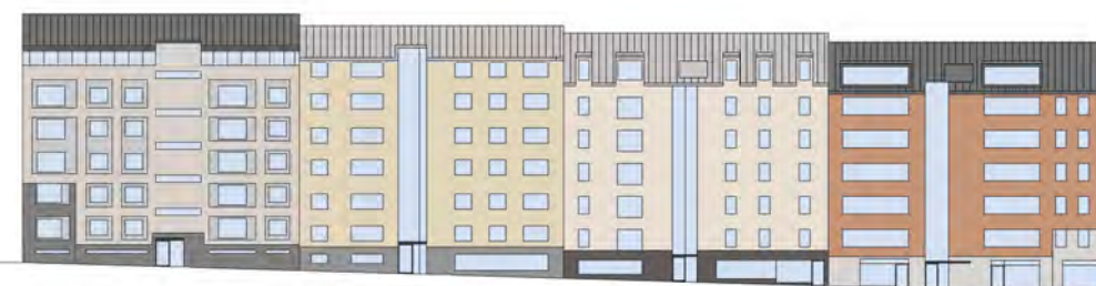
Fasad mot Luntgatan