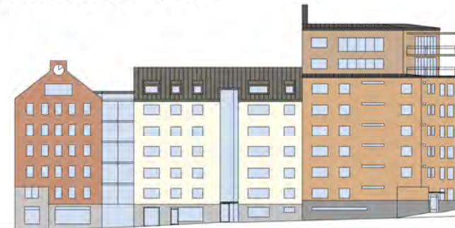
Fasad mot Norra Promenaden