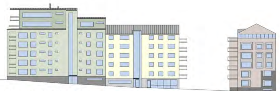
Fasad mot Slottsgatan