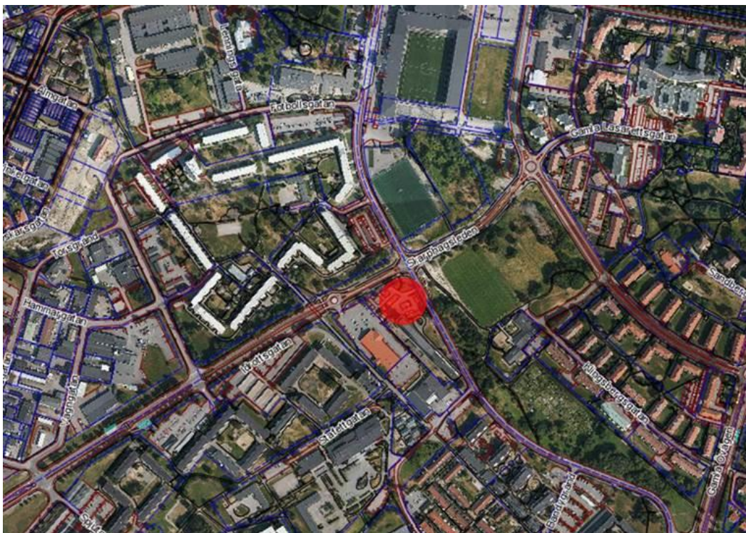
Fig. 1. Det efterfrågade området markerat med rött.

Angående förfrågan om Arkeologisk utredning etapp 1 (frivillig utredning) inom fastigheten Planen 4, Norrköpings kommun.