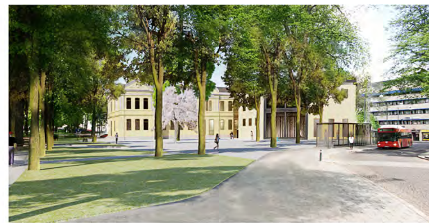
Vy från Södra Promenaden