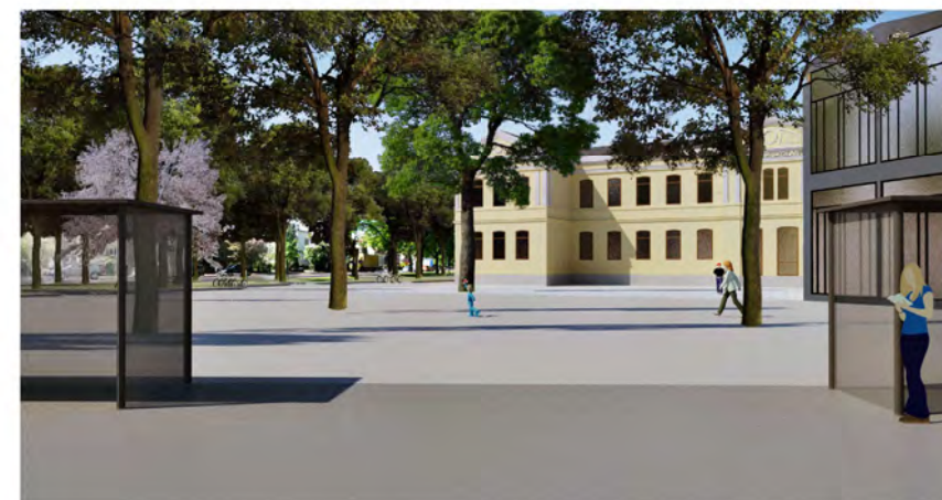
Vy från Södertull