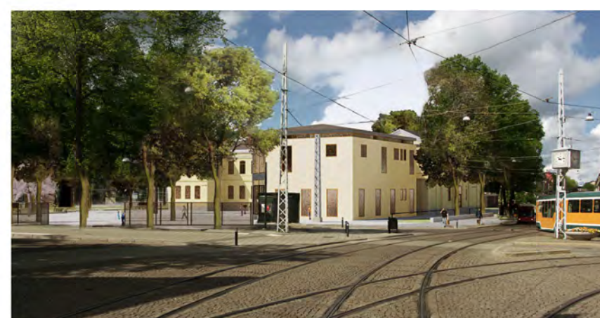
Vy från korsningen Drottninggatan/ Nygatan