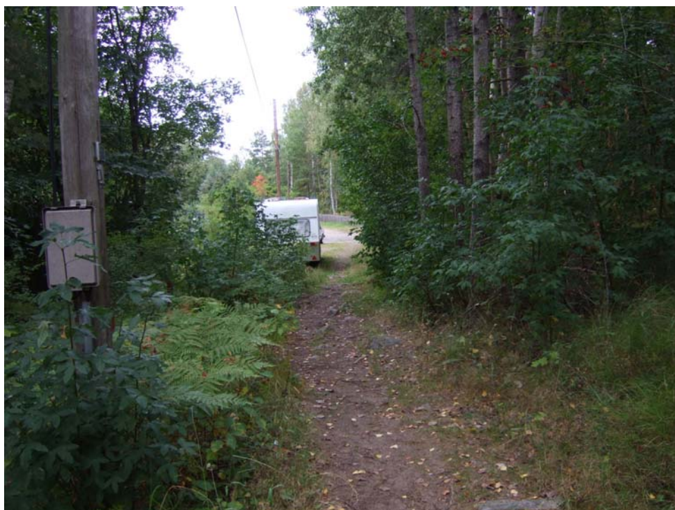
Pukstensvägen är bitvis en stig och därför inte öppen för genomfart med bil.