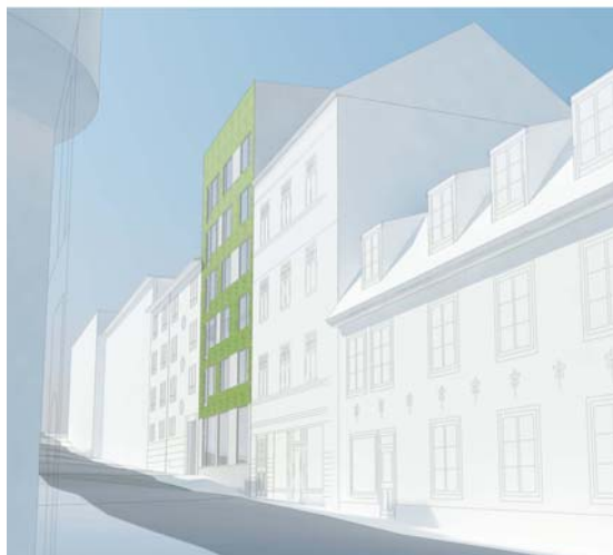
Förslag till ny byggnad. Vy från St. Persgatan.

Byggnaden föreslås bli sex våningar mot St. Persgatan och utmed Kvarngatan till hälften sju och till hälften fem våningar (suterängplan medräknat).