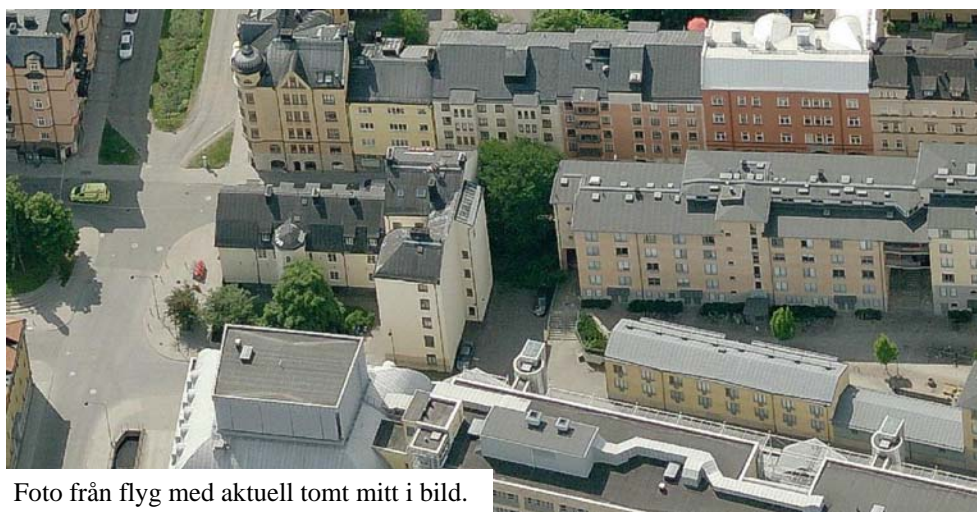
Foto från flyg med aktuell tomt mitt i bild.

Tomten används idag för parkering. Det är en höjdskillnad mot St. Persgatan där det står ett stort träd i gränsen mot gatan.