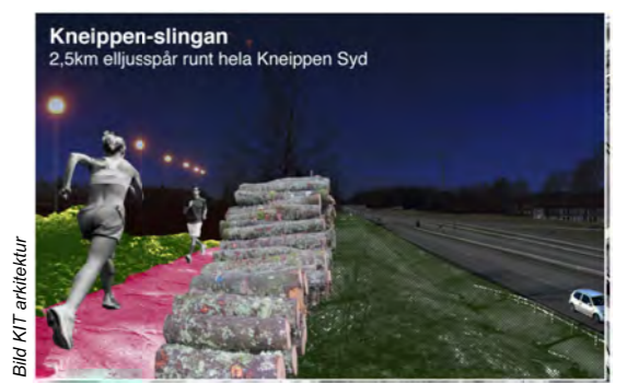
Kneippen-slingan Pespektiv vid Linköpingsvägen