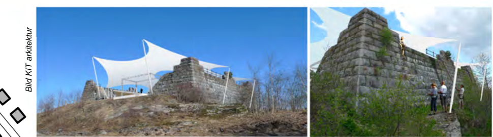
Scen och klättring - Borgs vattenreservoar