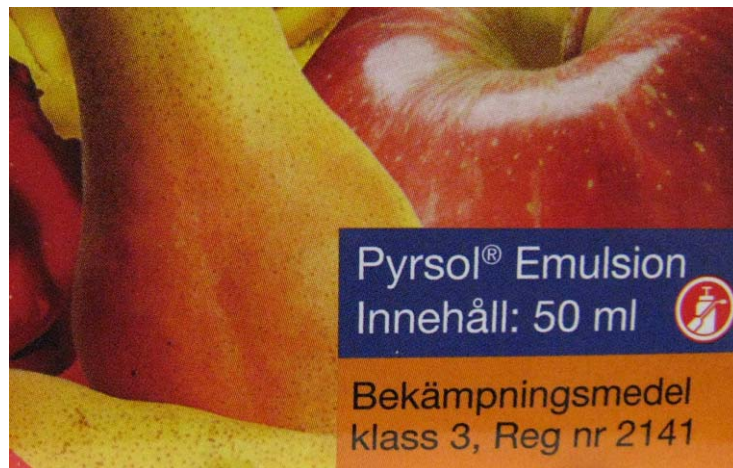
Bild 2. Exempel på hur registreringsnumret kan se ut på ett godkänt bekämpningsmedel.

Alla bekämpningsmedel ska vara godkända och i Sverige är det KemI som godkänner de produkter som får saluföras som bekämpningsmedel. Alla godkända produkter ska vara tydligt märkta med ett fyrsiffrigt registreringsnummer. Oftast står registreringsnumret med svart text på orange botten.