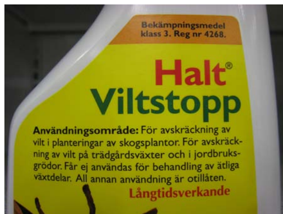
Bild 1. Exempel på en produkt som marknadsförs som avskräckande.

Det är alltså avsikten med produkten som avgör om det är ett bekämpningsmedel. Det är därför viktigt att granska hur produkten marknadsförs, inte bara vad den innehåller. Om produkten liknar ett känt bekämpningsmedel (exempelvis genom sitt innehåll), klassas det också som ett bekämpningsmedel.