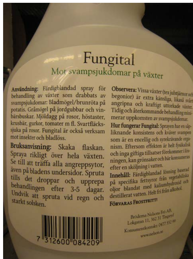
Bild 3. Exempel på en produkt som är fysikaliskt verkande.

Omkring 180 av produkterna var av någon anledning undantagna från de regler som gäller för kemiska bekämpningsmedel (se bilaga 3). De klassades därmed inte som bekämpningsmedel. Den vanligaste orsaken till att en produkt är undantagen beror på att den är fysikaliskt verkande. Kortfattat kan det beskrivas som att produkten eller medlet påverkar exempelvis skadeinsekten utifrån, istället för att till exempel påverka dess andningsorgan. Ett klassiskt exempel på en fysikaliskt verkande produkt är flugspiralen med klister. En annan stor produktgrupp som anses vara fysikaliskt verkande är de växtskyddsmedel som innehåller såpa, mineralolja eller liknande.