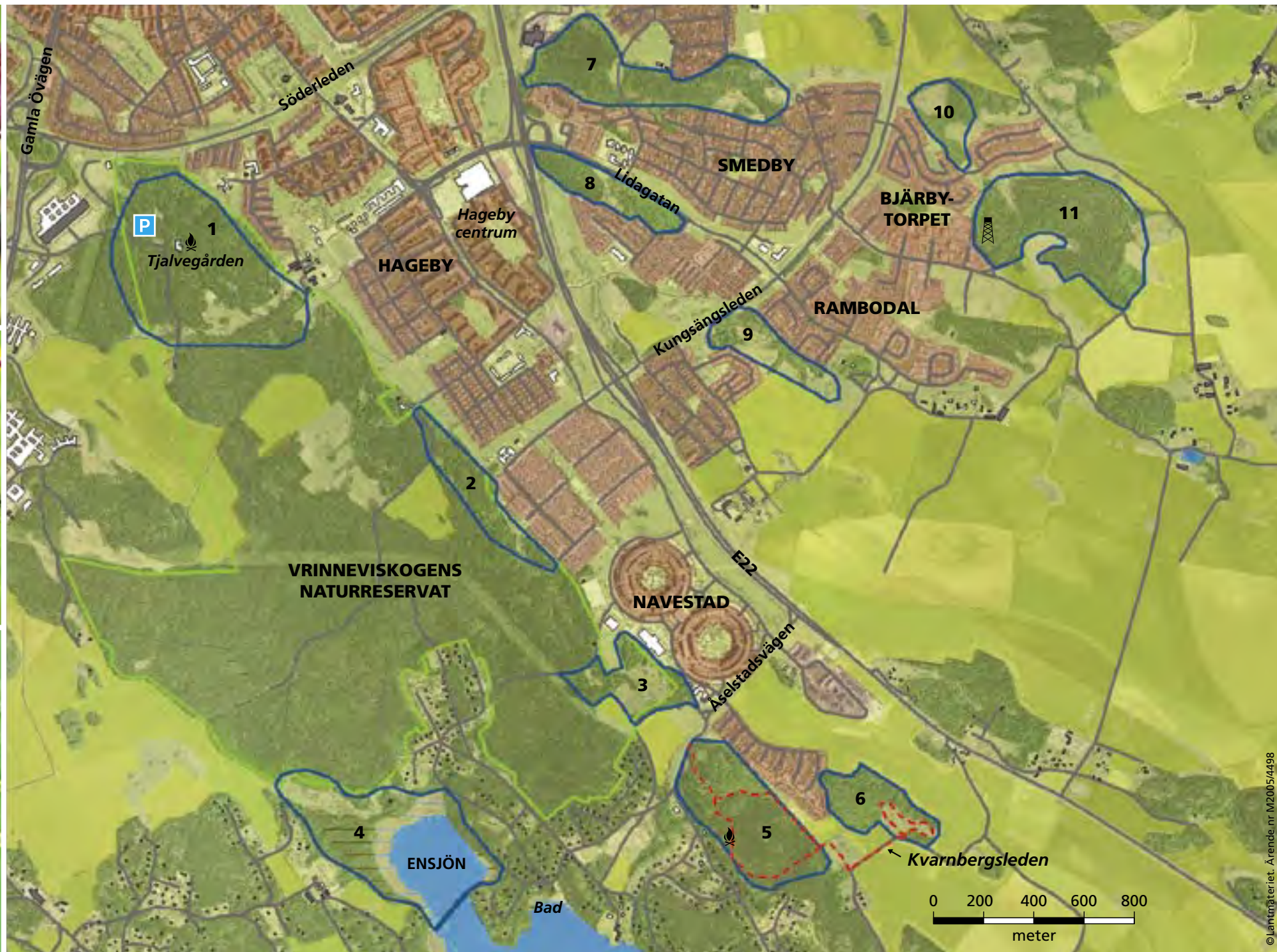
Naturliga upptäcktsfärder runt Hageby, Navestad och Smedby. Var börjar din upptäcktsfärd?